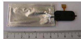
Mikropumpe mp6 with reservoir bag

Durch die kleinen Abmessungen und attraktive Stückzahlpreise sind Mikropumpen für diesen Einsatz prädestiniert. Die geringe Größe der Mikropumpe mp6 von 30 x 15 x 3,8 mm 3 ermöglicht die Unterbringung im Gerät in Kombination mit einem Reservoir und der Elektronik bzw. Betätigungselement auf kleinstem Raum. So können hochintegrierte Funktionsbausteine geschaffen werden, die den Produktnutzen für den Endanwender in verschiedenen Bereichen erhöhen.