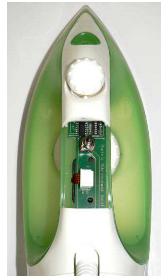
Pumpenmodul im Gerätegriff

Neben den Standardprodukten bietet Bartels Mikrotechnik die Entwicklung kundenspezifischer Pumpen an, sowie die fluidische Systemintegration.